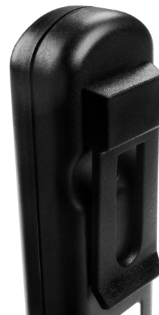
wersja z zaczepem do paska PUK-303/Z